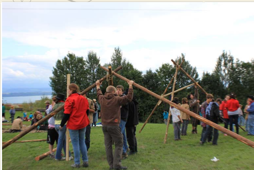
Samedi en fin d'après-midi, tous les cowboys étaient à l'oeuvre pour s'installer dans la ville.