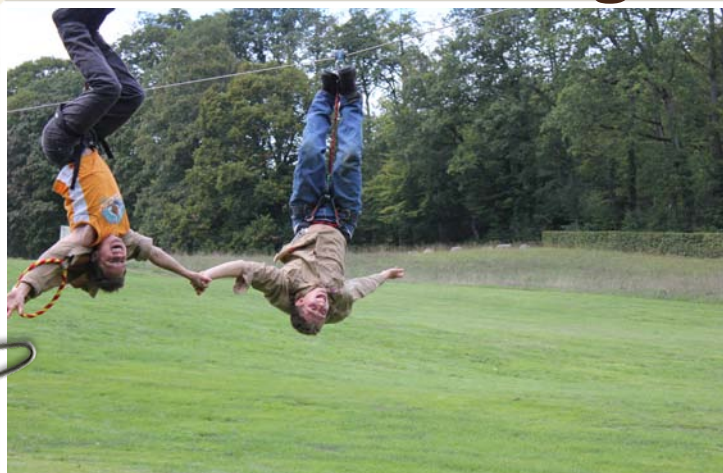
CityTown sans dessus dessous... Les éclais la tête en bas.