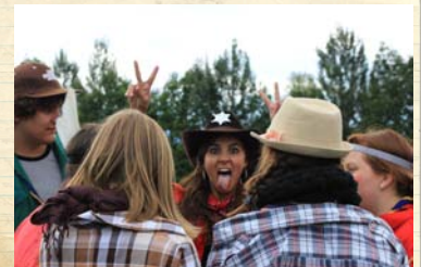
Ambiance Rock'n'Roll lors de l'arrivée des CowBoys à CityTown.