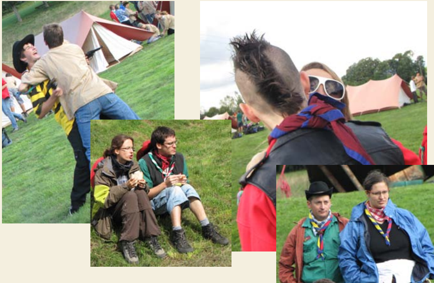
Différents couples se sont affichés pendant la journée, sur le territoire de la ville de CityTown.