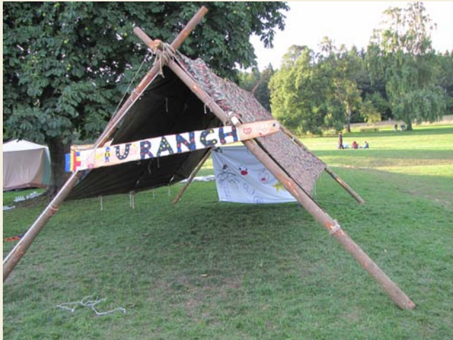
Le ranch a gagné le concours du meilleur commerce.