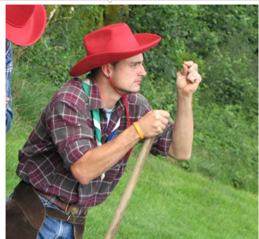
Pépito fasciné par l'immense pépète qu'il vient de trouver.